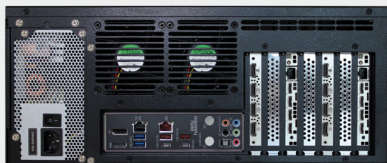
VuScape VS120-2, face arrière