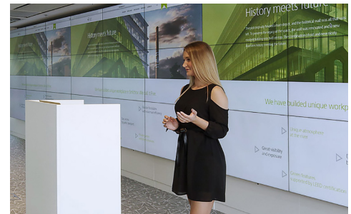
PRÉSENTATION ET COLLABORATION