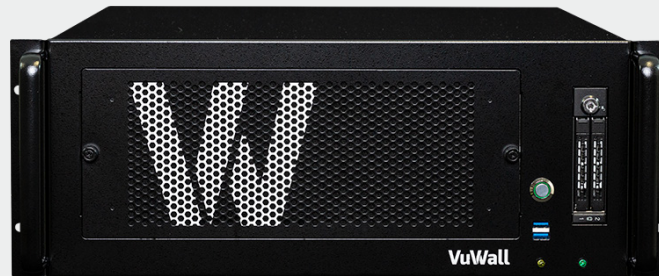
VuScape VS120, VS280, VS640