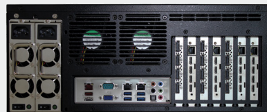
VuScape VS280-2, face arrière