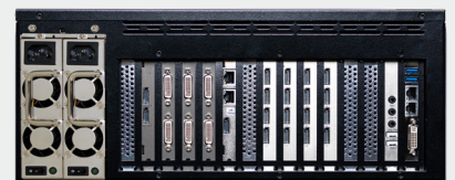
VuScape VS640-3, face arrière